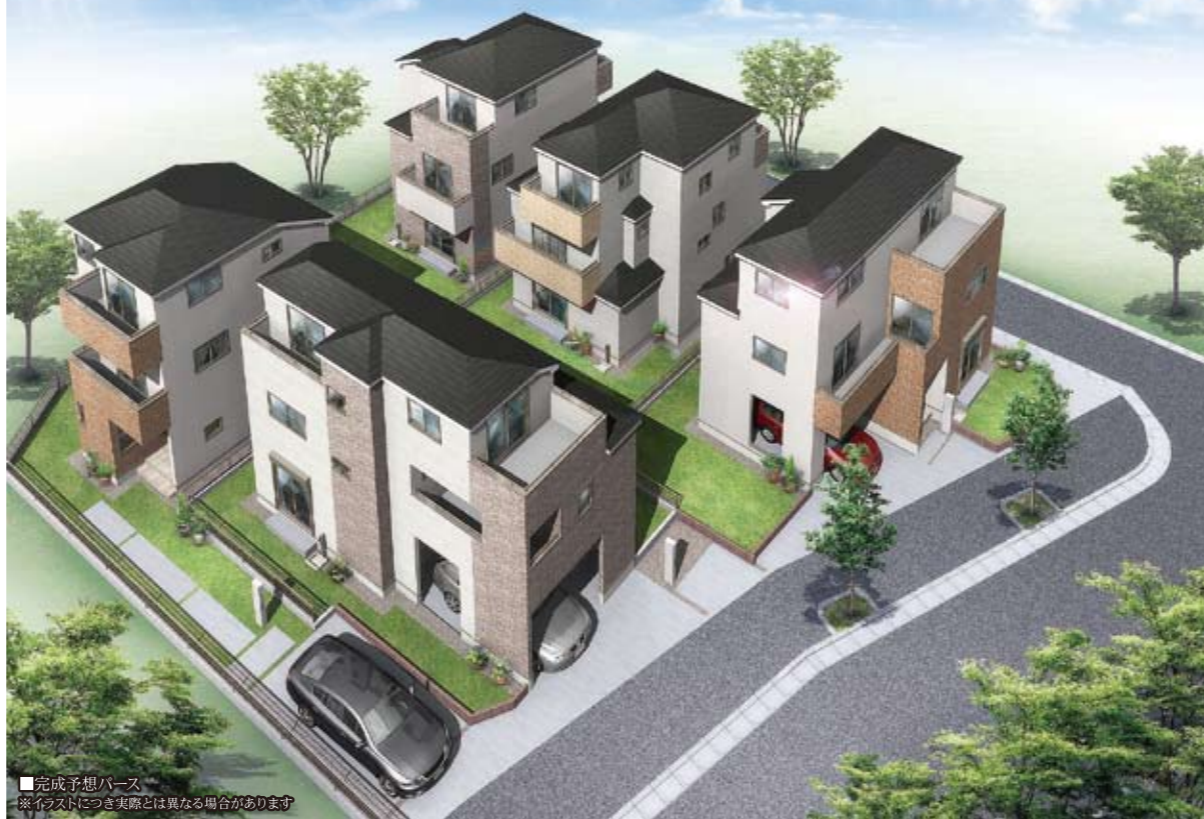
■完成予想パース ※イラストにつき実際とは異なる場合があります