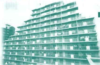
リノベーション内容 (H23年12月)