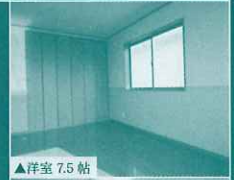
▲洋室 7.5 帖