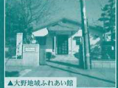
▲大野地域ふれあい館