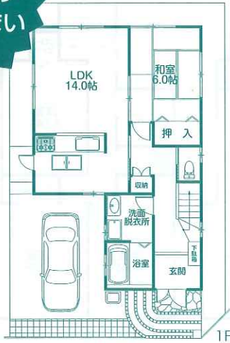
6 M 道路